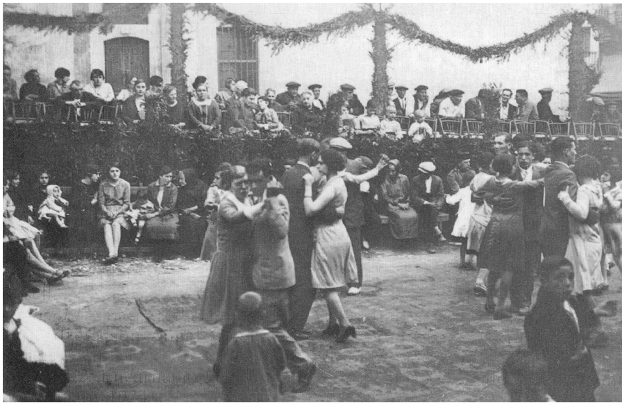
Ball de Festa Major a Bagà. Principis dels anys 1930.

A tots els amics i amigues, companys i companyes, balladors i balladores, que mantenen viva l'associació cultural Berguedana de Folklore Total i que han incorporat la dansa a les seves vides, i a totes aquelles persones que haguem pogut oblidar d'esmentar però que d'alguna manera han ajudat a donar forma a aquest llibre.