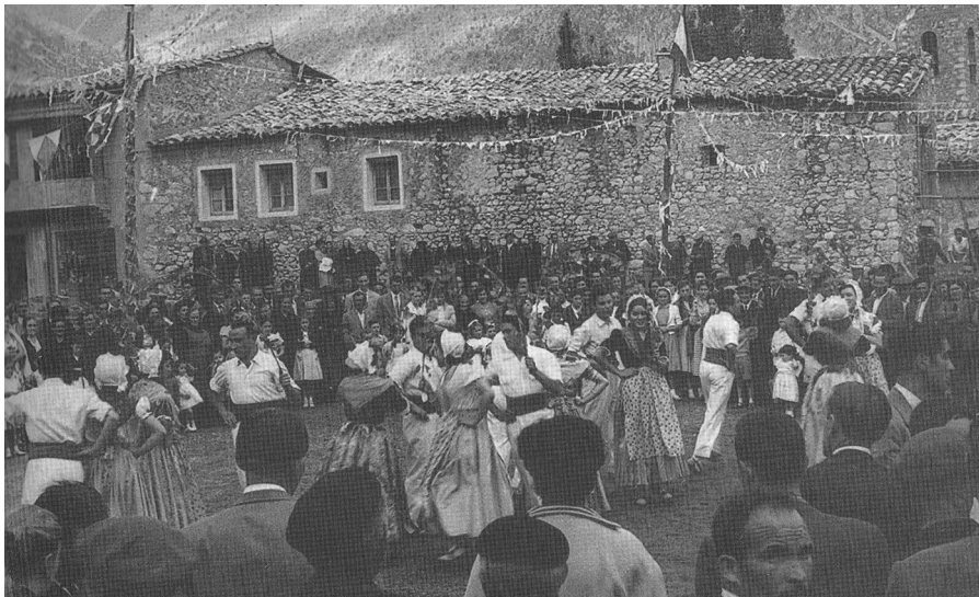
Ballada de l'Esbart Cadí de Bagà a Gósol, possiblement l'any 1952.

acompanyada d'uns gràfics que facilitaran ballar-la, la partitura i les fonts de les que hem extret la informació. Hem posat les partitures en el to més freqüent o bé el que apareix en les fonts consultades.