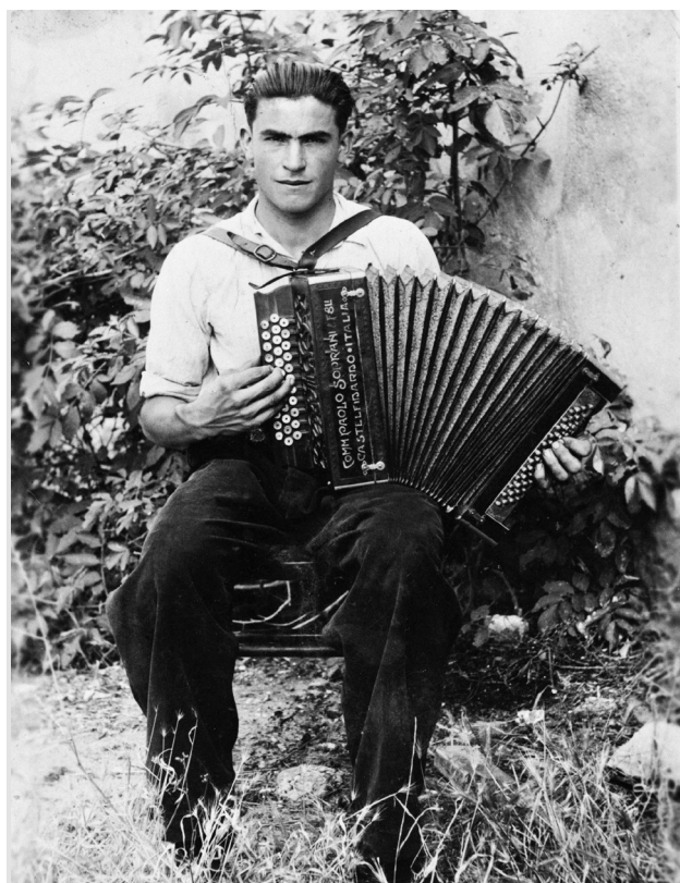
Acordionista. Berga. Anys 1940-50.

Vilarmau Cabanes, Josep M. (1997) Folklore del Lluçanès . Coordinat pel Grup de Recerca Folklòrica d'Osona. Ajuntament de Prats de Lluçanès.