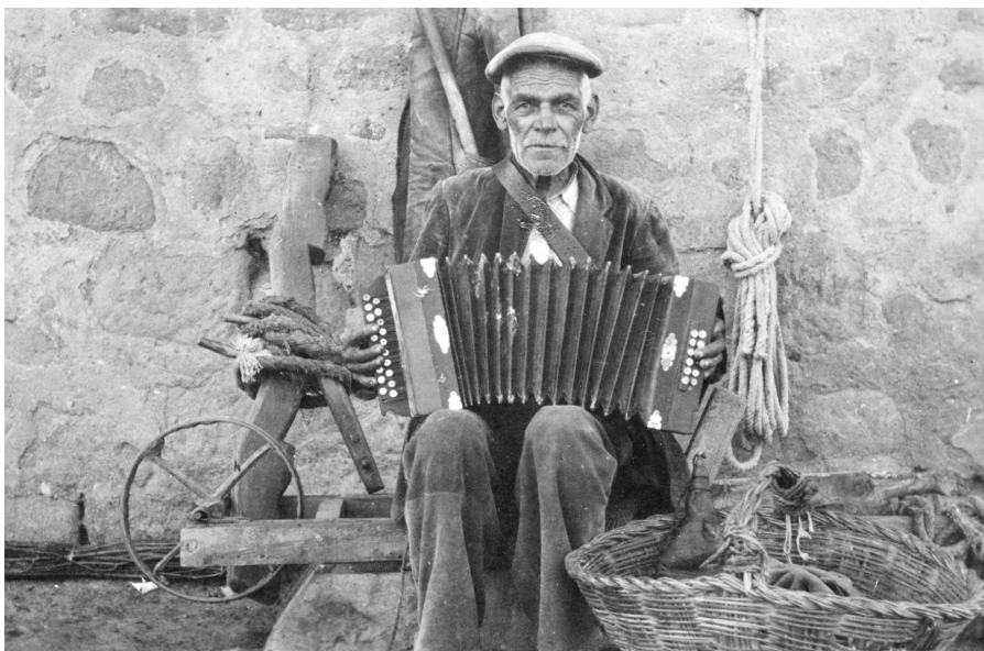
Acordionista a Avià. Principis del segle XX.