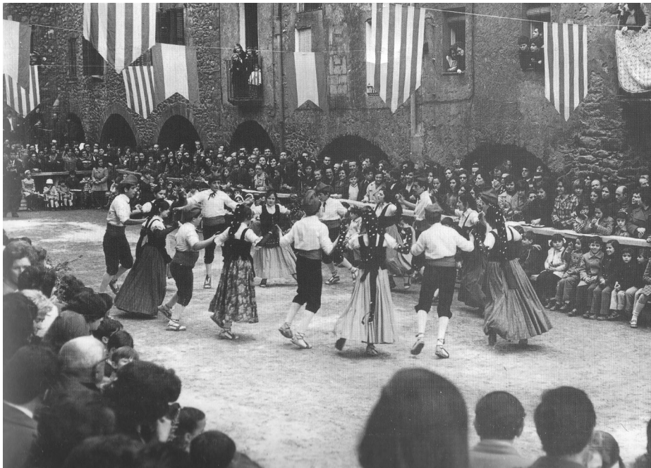
La bolangera de Bagà ballada per l'Esbart Cadí de Bagà. Festa de l'Arròs a la plaça Porxada. Any 1972. Arxiu de l'Esbart Cadí de Bagà.

És una dansa en cercle que s'havia ballat molt i a molts llocs i per això hi ha moltes versions, tant de la música com del ball. Al Berguedà coneixem bolangeres a Berga, Bagà, Gósol, Gisclareny, la Pobla de Lillet, Santa Maria de Merlès i Sant Julià de Cerdanyola. Totes elles comparteixen l'aire alegre, el ritme binari, l'inici en anacrusi i el tenir dues frases musicals, la primera sempre de 8 compassos i la segona de 8 o 10.