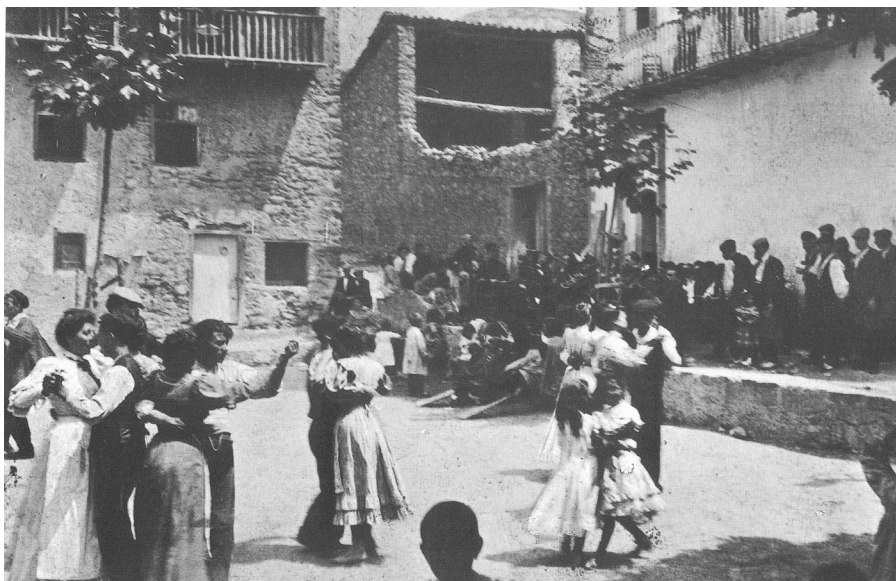
Ballada popular a la placeta de cal Boira de Bagà. Principis de segle XX.