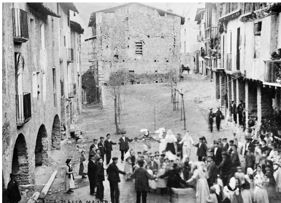
Balls a la plaça Porxada de Bagà. Inicis del segle XX.