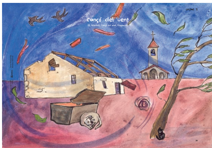
Malagarriga; Martínez. UD4, llibre de l'alumne/a, cançó del vent , pàg. 28 Els músics més petits . Barcelona: Dinsic, 2006

El suport visual a través de les imatges dels compositors, d'il·lustracions sobre els aspectes relacionats amb les obres, els de dibuixos i/o de grafies ens són de gran ajut i fan possible que es mantingui l'interès per l'obra.