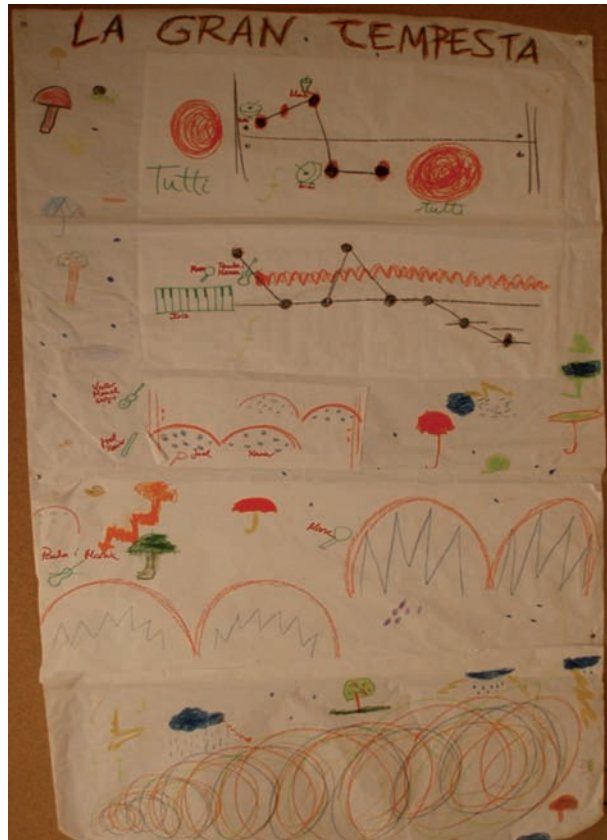
Partitura final d'una creació Conté força elements de grafia abstracta